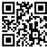
RT NT O-NET